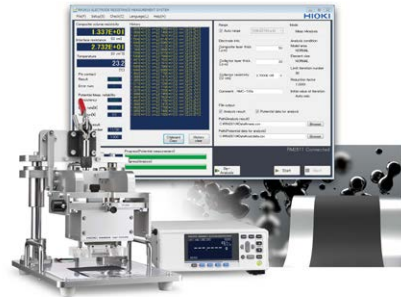
HIOKI RM2610 电极电阻测试系统

Zihrul, C.; Lippke, M.; Kwade, A. Model Development for Binder Migration within Lithium-Ion Battery Electrodes during the Drying Process. Batteries 2023, 9, 455 https://doi.org/10.3390/batteries9090455